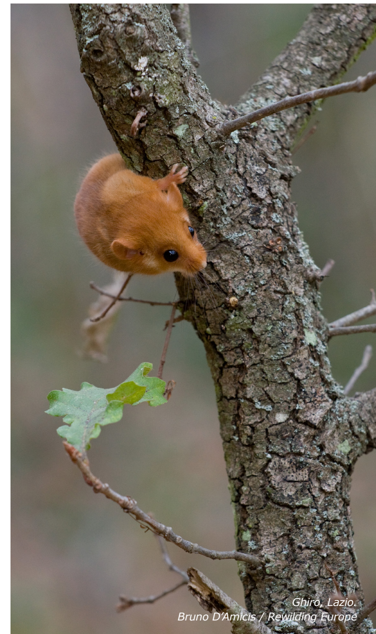
Ghiro, Lazio.