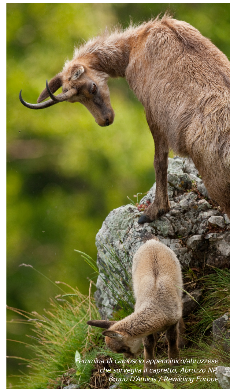
Femmina di camoscio appenninico/abruzzese che sorveglia il capretto, Abruzzo NP.

Per l'esercizio della pesca occorre il consenso del proprietario del fondo.