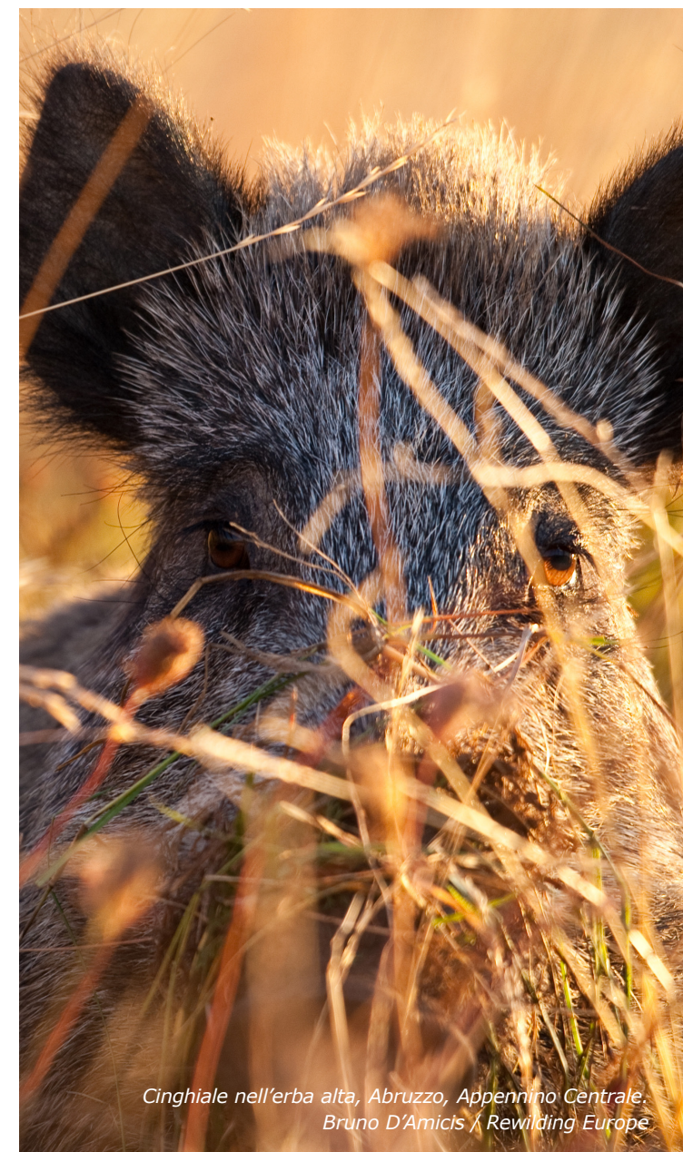
Cinghiale nell'erba alta, Abruzzo, Appennino Centrale.

In caso di ingresso forzato o violento, oppure ove si ritenga che sia stato commesso un reato all'interno della proprietà, oppure in caso di minaccia di condotta criminale, rivolgersi alla polizia, descrivendo la condotta e chiedendo assistenza immediata. Una volta sul posto, la polizia potrà informare il proprietario della possibilità di sporgere denuncia a carico dei trasgressori e/o chiedere il risarcimento di eventuali danni subiti.