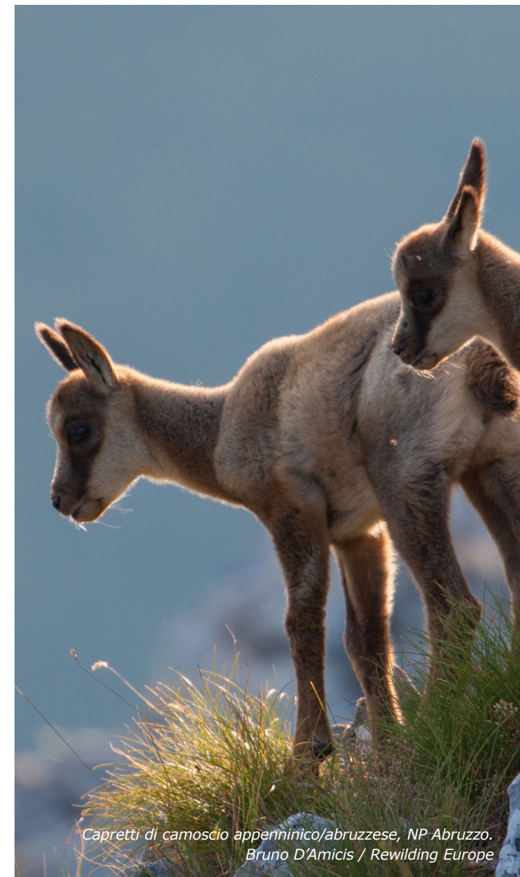
Capretti di camoscio appenninico/abruzzese, NP Abruzzo.

Nel secondo caso (2), per costituire una servitù di pascolo sul fondo altrui, è necessario essere